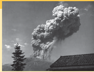
昭和33(1958)年12月14日の噴火による噴煙の様子

噴火した場合、火口から4km以内では、50cm程度までの大きな噴石(岩塊)が飛んでくる可能性があります。明治時代以降の噴火で犠牲になった方々は、全て火口から4km以内にいた登山者で、噴石(岩塊)の直撃を受けて亡くなっています。